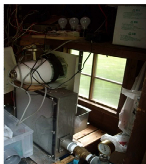
内部の発電器と水車 Box