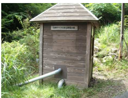
比良マイクロ水力発電小屋